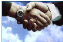
ICT-managers niet eerder zo positief over investeringen

3 maart 2008 - Van teruggang van de economie is geen sprake, in ieder geval niet op ICT-gebied. Dit blijkt uit de laatste ICT Barometer van Ernst & Young onder ruim 600 managers bij de overheid en het Nederlandse bedrijfsleven.